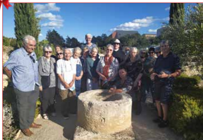
Le CRAC (Comité Rural d'Animation de Caves) lors des Journées du Patrimoine - Visite du Clos de la Lombarde à Narbonne.