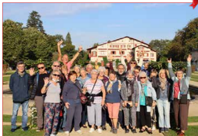
L'Âge d'Or lors de son voyage annuel au Pays Basque.